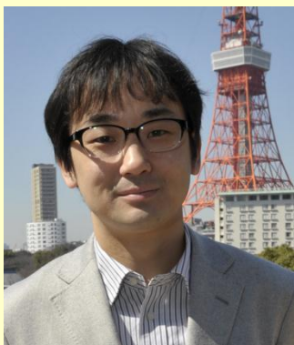
登美 斉俊（とみ まさとし）

1971年信州大学理学部卒業、1971年4月信州大学医学部衛生学講座助手、1982年10月医学博士（信州大学）、1982年12月信州大学医学部衛生学講座講師、1983年9月より6ヶ月大阪大学蛋白研究所内地留学、1988年9月より4ヶ月文部科学省在外研究員として、1989年7月より3ヶ月FIOH研究所奨学金で、1992年5月より5ヶ月日本学術振興会海外派遣事業で、Finnish Institute of Occupational Healthに留学、2001年6月信州大学医学部衛生学講座助教授、2002年1月名古屋大学大学院医学系研究科環境労働衛生学教授、2006年4月より3年間日本学術振興会学術システム研究センター研究員兼務、2011年10月より日本学術会議会員、2012年4月名古屋大学名誉教授、中部大学客員教授