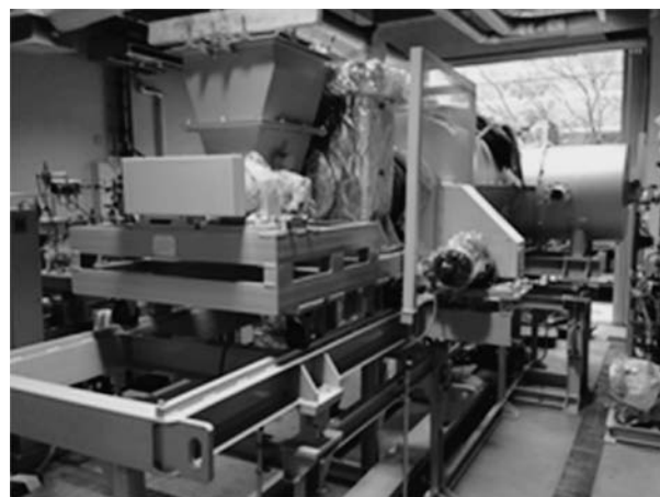
図1 実証試験装置の概観

対象海域とした気仙沼湾の油分（ノルマルヘキサン抽出物質濃度、TPH, PAHs）分布を採泥によって調べたところ、ノルマルヘキサン抽出物質濃度は湾奥で高く、湾内の広い範囲で水産用水基準を超えていた。また PAHs は東湾で高かった（中村ら、未発表）。気仙沼湾の底質から効率的に油分を取り除くためには、高濃度の油分の位置を詳細に把握する技術の開発が必要である。そこで、紫外レーザーを利用した観測システムを構築した。本システムは海面から紫外レーザー（波長 355 nm）を照射し、海底の油の蛍光を海面の集光器で検出するので、海水が清澄な海域では水深 20 m 程度までの油の検出が可能である（戸口ら、未発表）。しかしながら、