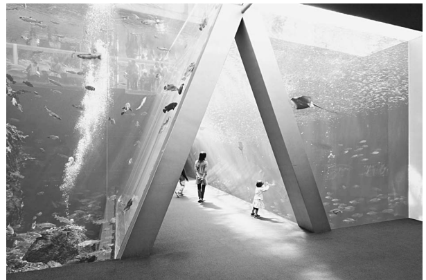
潮目の大水槽（左：親潮，右：黒潮水槽）

維持する機能を全て失いました。続いて東京電力福島第一原子力発電所事故が追い打ちをかけ、3月14日に職員は自宅待機（各自の判断で自主避難）という指示を受けました。トド、セイウチ、ゴマフアザラシ、ユーラシアカワウソなどの水生哺乳類、ウミガラスやエトピリカなどの海鳥は、16、17日の両日、鴨川シーワールドの職員の懸命な救援活動を得て搬出しましたが、20万点の飼育生物の内の9割を失いました。